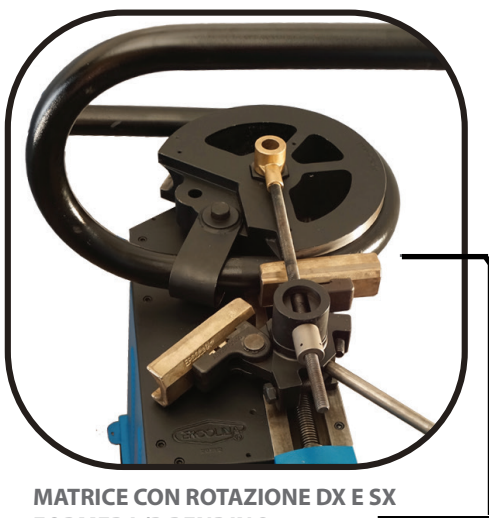
MATRICE CON ROTAZIONE DX E SX FORMER L/R BENDING