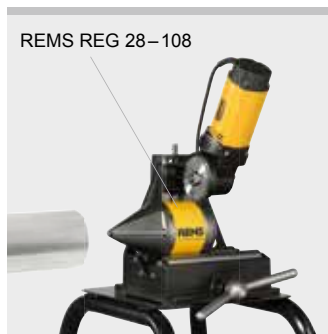
REMS REG 28–108