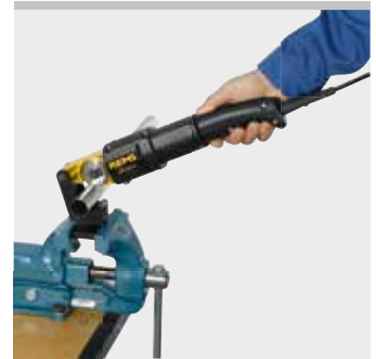
Kvalitní německý výrobek