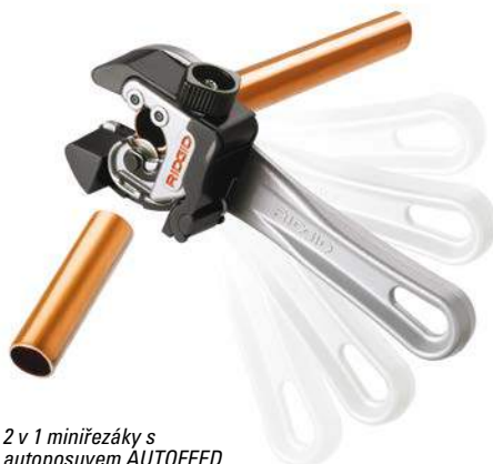
2 v 1 miniřezáky s autoposuvem AUTOFEED