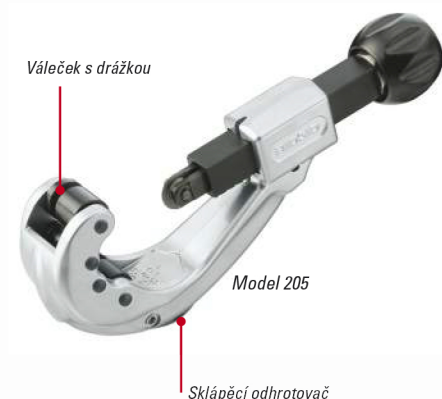
Váleček s drážkou