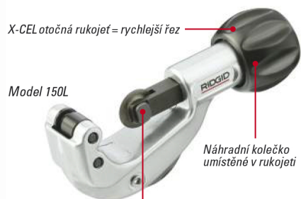
X-CEL otočná rukojeť = rychlejší řez